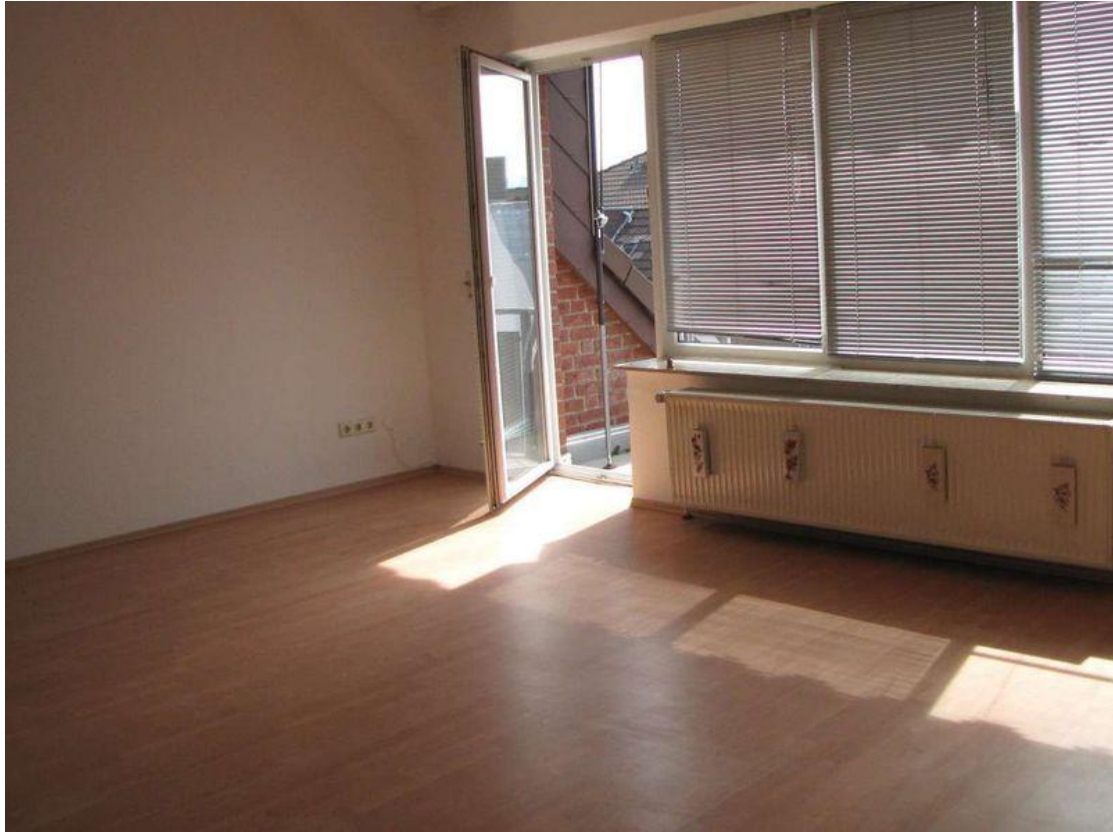
Wohnzimmer mit Balkon